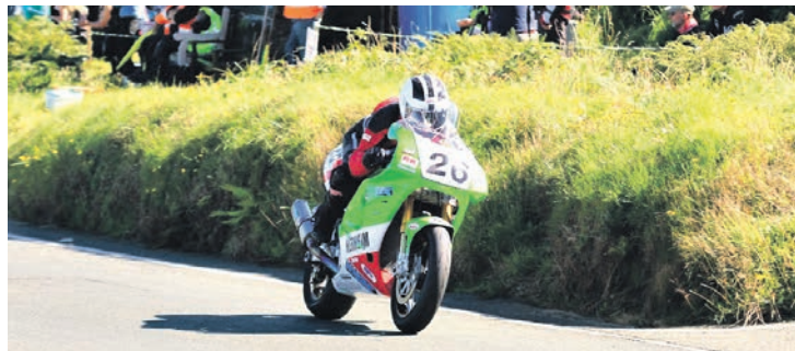
FULLT FRES: Racet på Island of Man er beryktet.